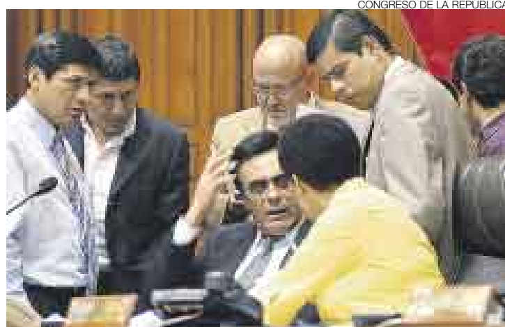
EN CARRERA. Arduo fue el debate entre los voceros para salvar la norma.

Sin embargo, en lugar de aprovechar la masiva presencia de sus colegas en el hemiciclo, el presi-