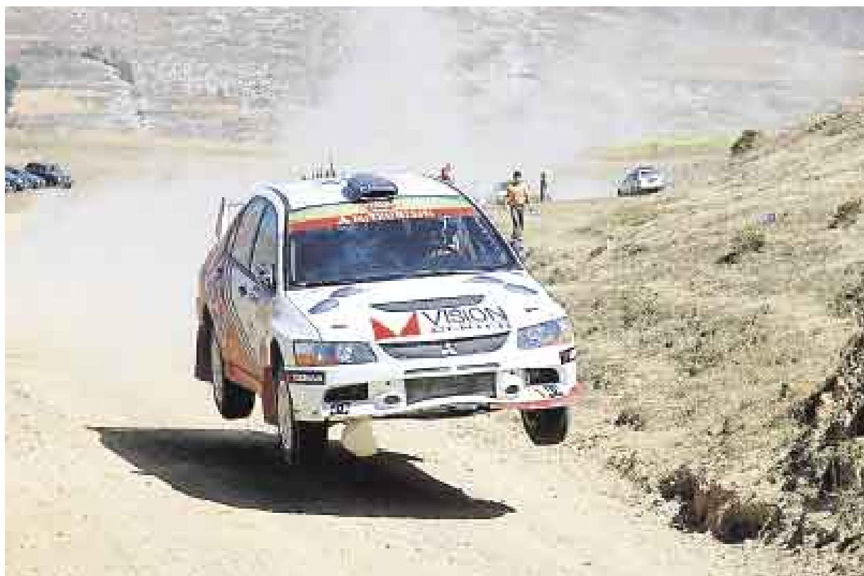
VOLADOR. Nicolás Fuchs ahora sí podrá contar con su Mitsubishi Evo IX, por eso vuelve a ser uno de los candidatos fijos.

El rally de Jauja tendrá algunos ingredientes especiales. Uno de ellos será el trazado nuevo para los pilotos, por lo que todos estarán en igualdad de condiciones en cuanto al