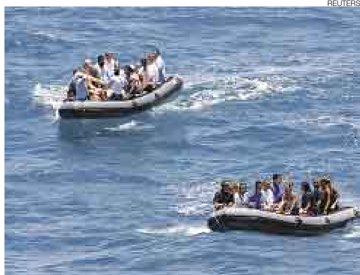
LIBRES. Los tripulantes de la embarcación regresarán pronto a Francia. Seis piratas fueron capturados mientras intentaban escapar.

La liberación de los rehenes, 22 de ellos de nacionalidad francesa y el resto entre ucranianos y filipinos, se produjo sin emplear la fuerza después de que el armador del barco pagara un rescate de unos dos millones de dólares a los piratas, que abandonaron el velero y permitieron la llegada de los agentes galos.