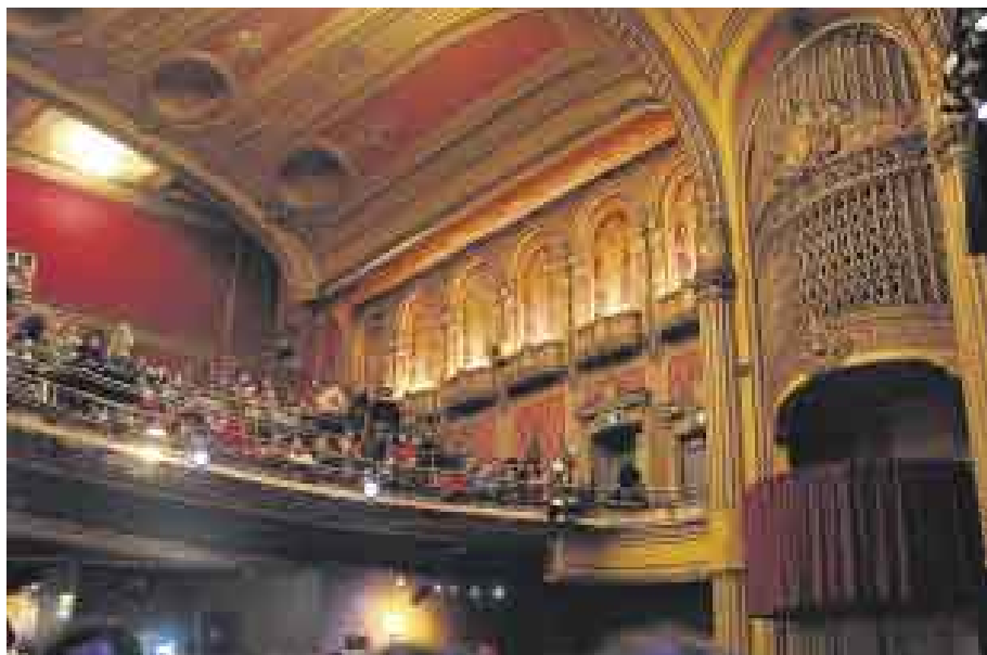
ESCENOGRAFÍA HISTÓRICA. El concierto se realizó en el Warfield Theatre, auditorio construido en los años 20 y otrora segunda casa de bandas psicodélicas como The Grateful Dead.

cierto. Le siguieron la nostálgica "Where Have All the Good Times Gone" y "Till the End of the Day", ambas canciones del álbum "The Kink Controversy" (1965).