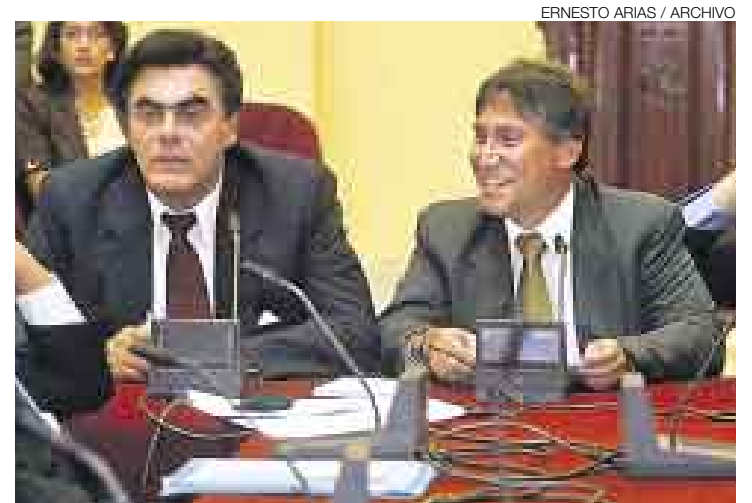
LO PERDONA. El presidente del Congreso, Luis Gonzales Posada, dio por superado el incidente con su colega Aurelio Pastor Valdivieso.