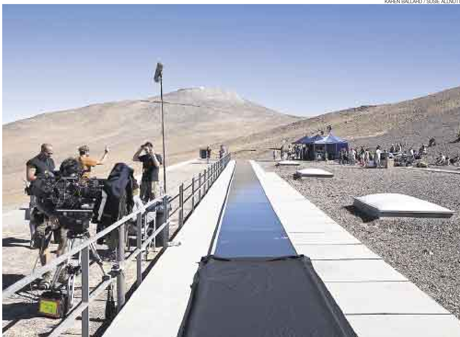
LA FILMACIÓN. En Chile la primera locación del rodaje fue el observatorio de Cerro Paranal, en el desierto de Atacama.

"Bond está con el corazón roto, quiere vengarse, pero también quiere encontrar lo que alu-