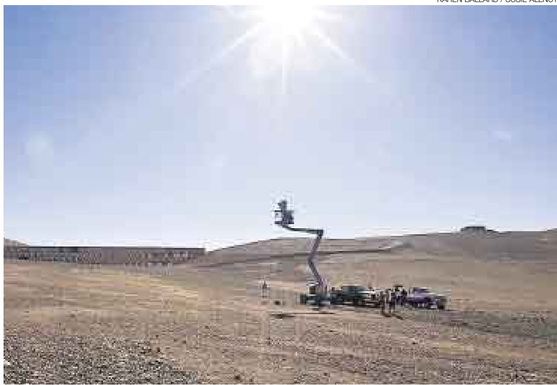
DESÉRTICO. El equipo británico de filmación soportó las condiciones climáticas más difíciles.