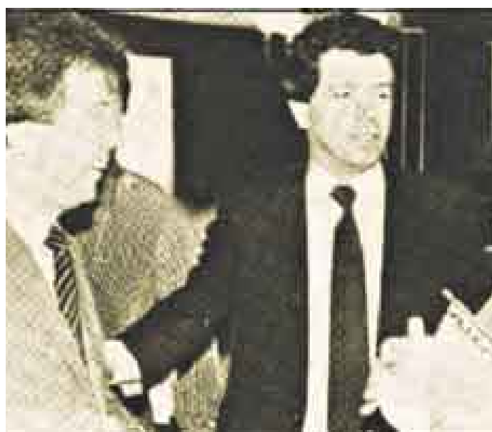
LOS CAPOS. Gilberto (izquierda) y Miguel Rodríguez Orejuela hoy purgan condenas por narcotráfico en cárceles de Estados Unidos.

“Me puso un vestido de mujer, me sacó amarrado a un carro y me paseó por la cuadra donde vivíamos”