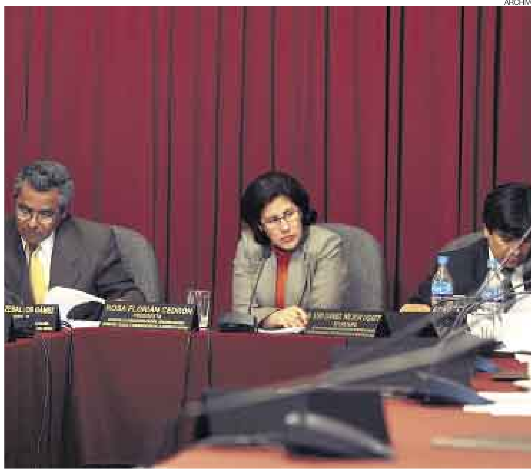
SEGUIMIENTO. La Comisión de Descentralización del Congreso espera respuestas del Poder Ejecutivo respecto de la actual reestructuración del Ministerio de Agricultura, vía el Decreto Legislativo 997.

Sin embargo, la Ley Orgánica del Poder Ejecutivo (LOPE) —vigente después de la ley autoritativa 29157— dispone que para redimensionar y reorganizar los mi-