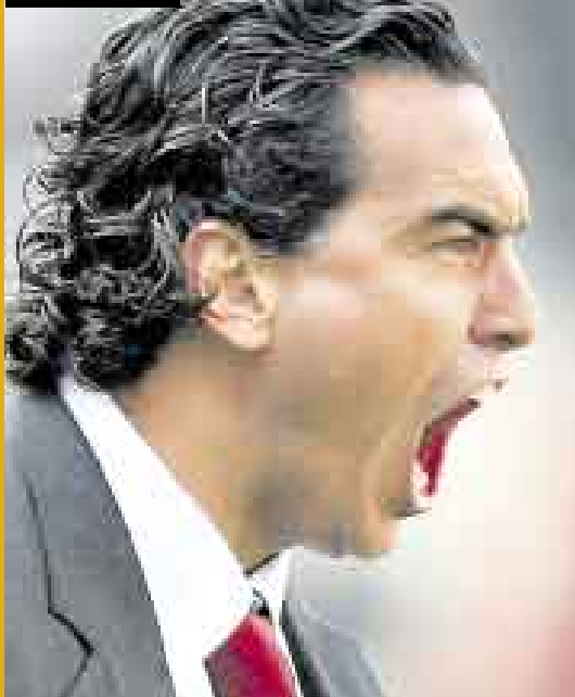
Chemo del Solar