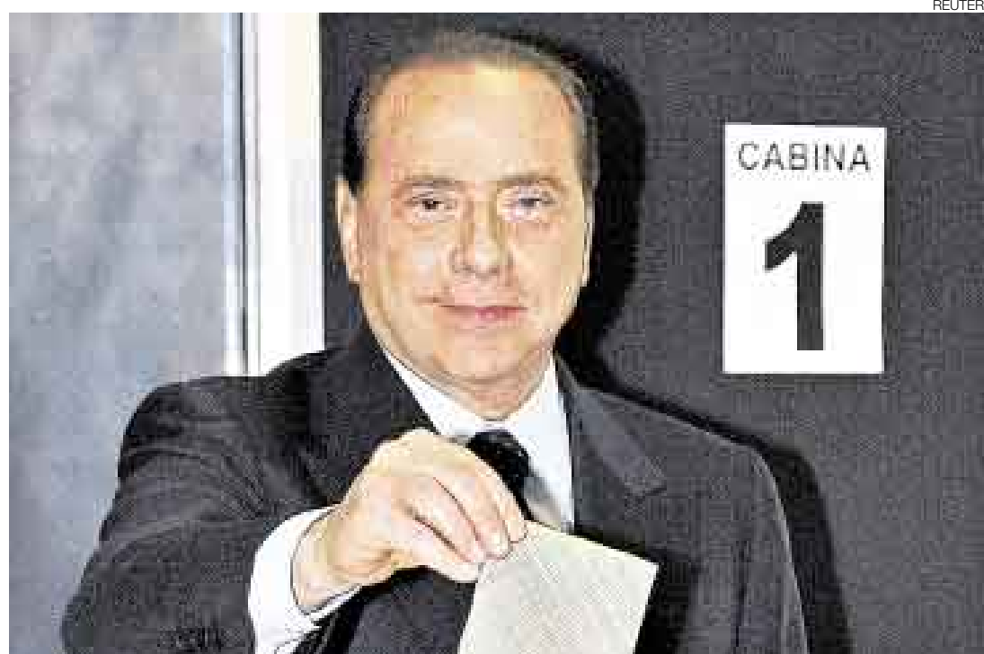
DE NUEVO EN EL PODER. Primer ministro entre 1994-1995 y 2001-2006, Silvio Berlusconi venció este domingo y lunes en las urnas a la lista progresista italiana por una diferencia aproximada de 7,5 puntos.