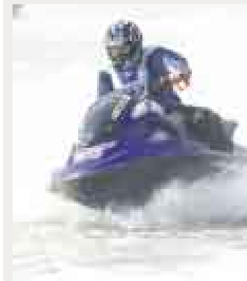
MOVIDO. Las motos acuáticas hicieron de las suyas en Barranco.