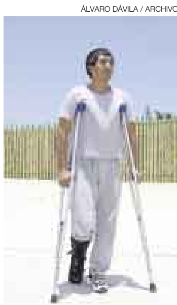
MALA PATA. En el 2004, cuando solo caminaba con muletas.

con lo que había ganado corriendo, para poder cubrir los gastos de mi familia”, explicó.