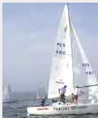
AL VIENTO. La clase J/24 tiene a Escándalo y Namayoc primeros.