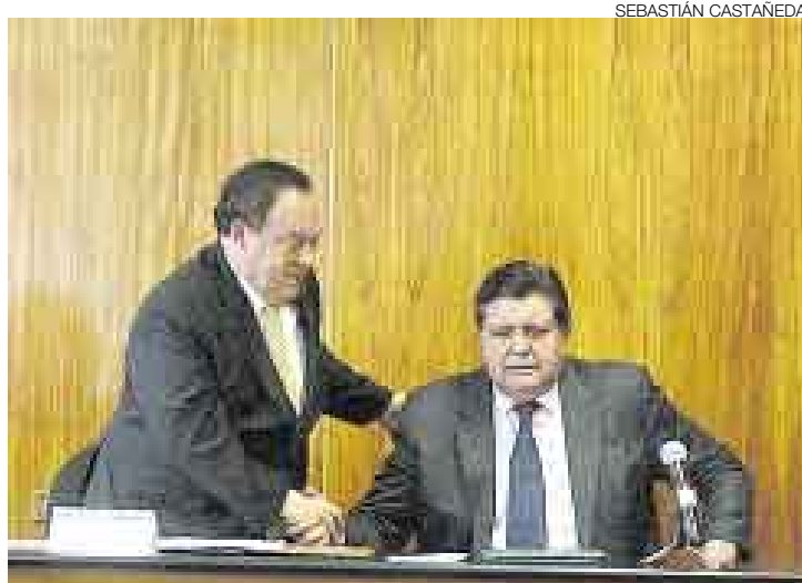
RESPALDO. El ministro Luis Alva Castro estuvo acompañado por el presidente Alan García en la suscripción del convenio con Petro-Perú.

El jefe del Estado, Alan García Pérez, presidió la ceremonia de suscripción del acuerdo de cooperación, que se realizó en el Ministerio del Interior. El convenio fue firmado por el titular de