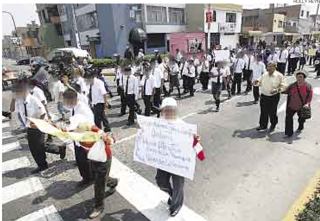
¿Y LAS CLASES? Los alumnos marcharon desde la Av. La Marina hasta la Av. Costanera, uniformados. Algunos estudiantes consultados señalaron que salieron de las aulas voluntariamente para participar en la manifestación.

Pero la protesta no fue solo vecinal. Llamó mucho la atención la presencia de al menos unos 70 escolares, todos uniformados, provenientes de los colegios Thomas Jefferson, Nuestra Señora de