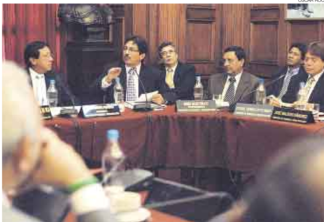
LEGGÓ TARDE. El ministro Enrique Cornejo señaló que ellos ya habían advertido los problemas, pero que la denuncia periodística se les adelantó y salió antes de que ellos pudieran tomar medidas correctivas.