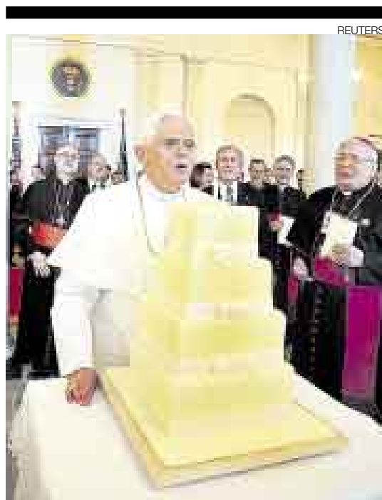
EN LA CASA BLANCA. El Papa celebró, pero también reclamó "el respeto por la vida en todas sus formas".

Los científicos creen que esta situación se debe a la capacidad de estos árboles para que de las reservas de sus raíces nazcan nuevos tallos y troncos y para adaptarse a los cambios climáticos. [A10]