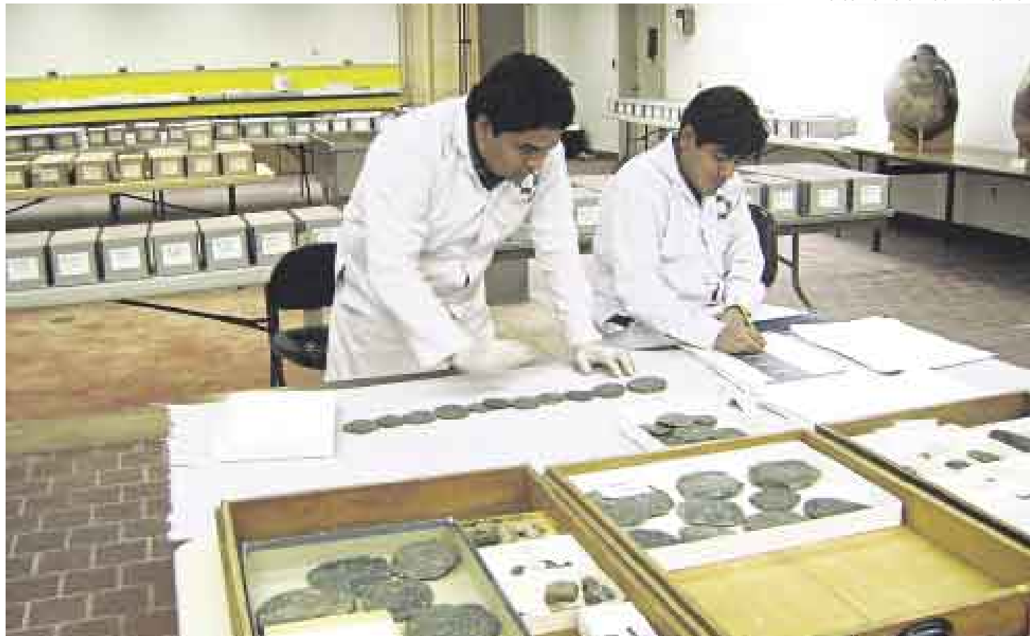
ARDUA LABOR. Siete especialistas del INC viajaron en marzo al Museo Peabody (de la U. de Yale) para evaluar los restos arqueológicos cusqueños.