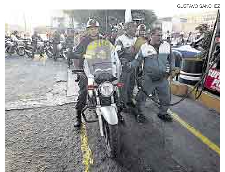
A LA POLICÍA SE LA RESPETA... Y SE LA CONTROLA. Llenar los tanques de las motos en grifos de Petro-Perú será obligatorio desde julio.

¿Y ADÓNDE SE IBA ANTES EL COMBUSTIBLE...?