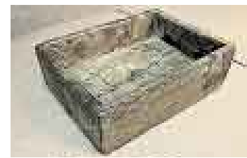
LÍTICO. Pieza hecha de piedra.