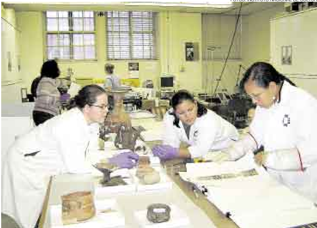
PARA CONOCIMIENTO DE TODOS. El informe final que consigna los trabajos de la delegación del INC en el Museo Peabody será publicado en el futuro para que cualquier peruano pueda tener acceso a tan valiosa información.

Igualmente se estableció que otras 369 piezas podrían tener condiciones singulares (museables), de acuerdo con una propuesta de selección entregada por la Universidad de Yale en marzo de este año.