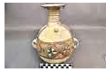
ARTÍSTICO. Ejemplo de cerámico.

A las sugerencias recabadas en esta nueva propuesta se unen modificaciones en el memorándum de entendimiento que el Perú suscribió con la Universidad de Yale en setiembre del