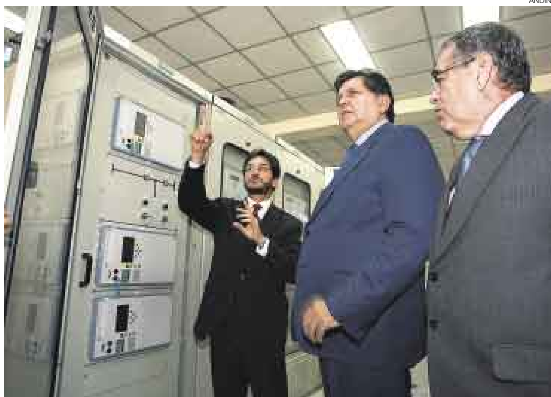
MOLESTIA PRESIDENCIAL. El jefe de Estado volvió a referirse a los malos funcionarios públicos.

Aunque el presidente García quiso dar a entender que no quería enfrentamientos con el gobierno anterior por el caso del Banmat, luego acotó: “Simplemente digo que antes de que acabara el ante-