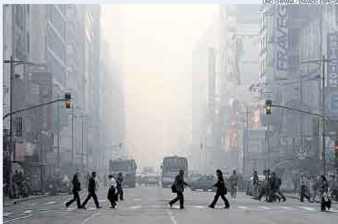
INÉDITA NEBLINA. La capital argentina respira desde hace días el humo de incendios ocasionados por agricultores.

■ En las guardias de los hospitales aumentaron las consultas por problemas respiratorios y alergias