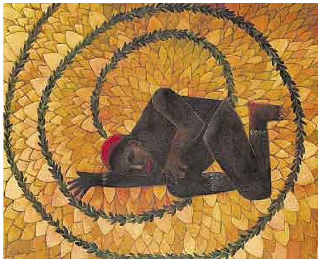
MULANOVICH. Su paleta siempre recuerda la tierra, pero sugiere especialmente la sangre.

Buen ejemplo es "Animal de invierno", pieza isométrica que recuerda lo primigenio y su duali-