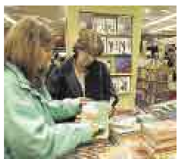
EN ALZA. Se alista una de las más grandes ferias en Latinoamérica.