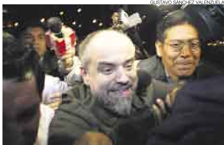
REO. Medelius se mostró extrañamente sonriente cuando llegó al país.

El ex notario fue traído al Perú en un vuelo de Delta Airlines, que