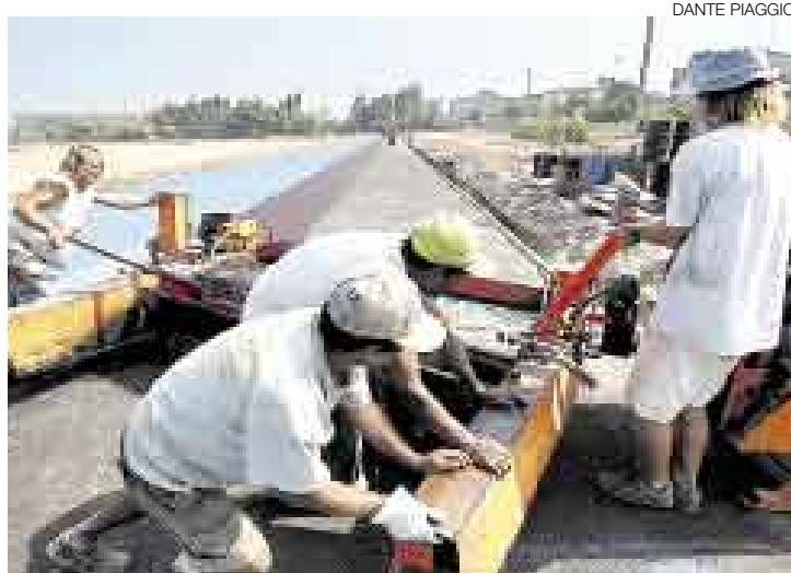
ÚLTIMO. Falta muy poco para que la pista de la Videna esté lista.

Resta por cubrir con el material sintético traído desde Alemania el tramo que da a la avenida San Luis, que no se hizo antes para permitir el paso de los camiones que estuvieron trabajando en la nivelación del cam-