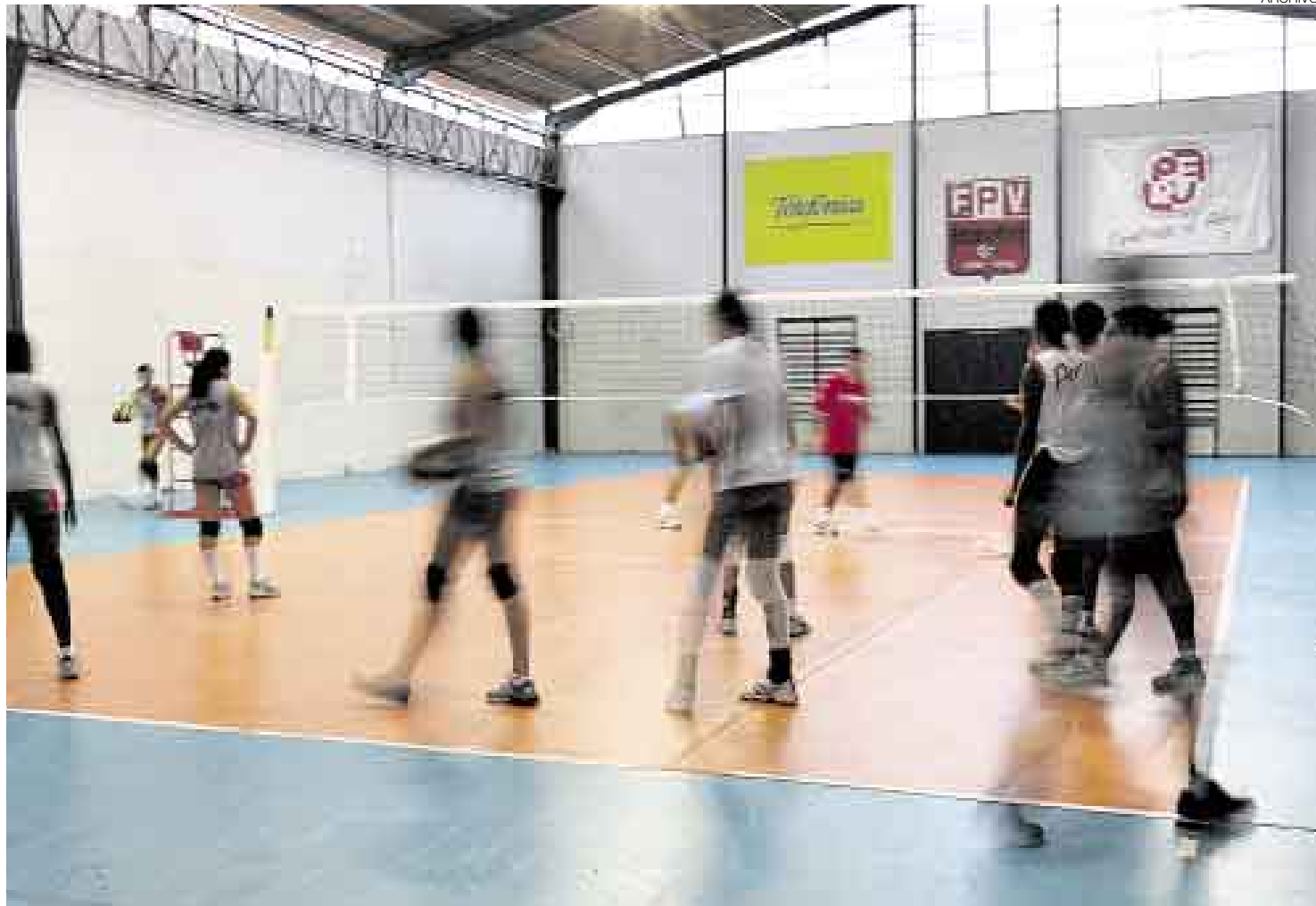
EN LA CALLE. Mientras los dirigentes no se ponen de acuerdo con el CAR, la selección de vóley continúa entrenando en el Circolo Sportivo Italiano.

“Nosotros le habíamos pedido que entregasen uno de los dos locales que tienen. Es más, les ofrecimos un cambio que los beneficiaba enormemente, pero ellos no quisieron. Recién cuando se dieron cuenta de que dejaban una cancha para pasar