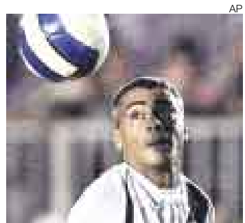
REY. Se escapó más de una vez de las concentraciones.

Río de Janeiro [DPA]. Romario puso fin a su carrera como futbolista pero no a su costumbre de sorprender con revelaciones explosivas: el 'Chapulín' confesó que mantuvo relaciones sexuales en un avión durante un viaje con el 'Scratch' y, además, dijo considerarse "mejor que Pelé".