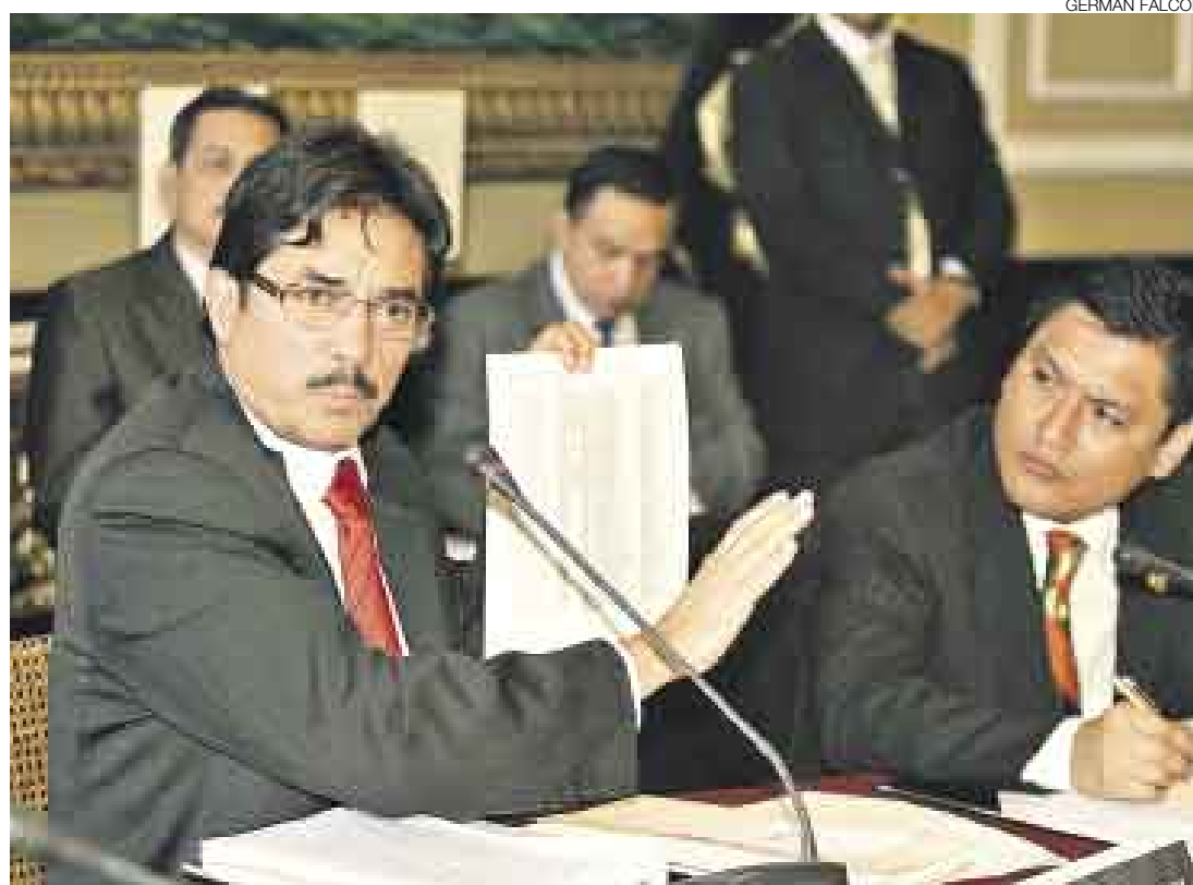
AHÍ NOMÁS. El ministro Cornejo culpó de todo al ex gerente y al ex auditor del Banmat, pero defendió al Fonafe.