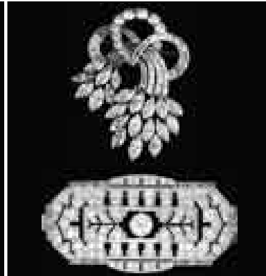
ALFILERES Y BROCHES DE DIAMANTE