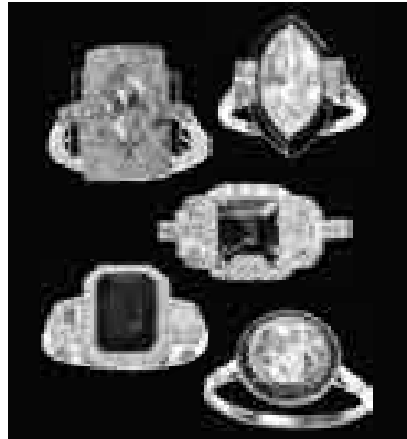
ANILLOS ANTIGUOS DE FILIGRANA

Joyas de Cualquier Tipo Nuevas o Usadas 8K-9K-10K-14K-15K-18K-19K-20K-22K-24K Montaduras de Oro hasta .....$500.00 Estuches de Relojes hasta .....$300.00 Anillos de Graduación hasta .....$200.00 Alfileres de Servicio hasta .....$30.00 Anillos de Boda .....$175.00 Cadenas y Collares hasta .....$4,000.00 Oro Dental hasta .....$403.00 Brazaletes con Dijes hasta .....$4,000.00 Lingotes .....Traígalos para avalúo LO COMPRAMOS TODO, DAÑADOS O GASTADOS, EN EFECTIVO CUALQUIER COSA HECHA DE ORO O PLATINO.