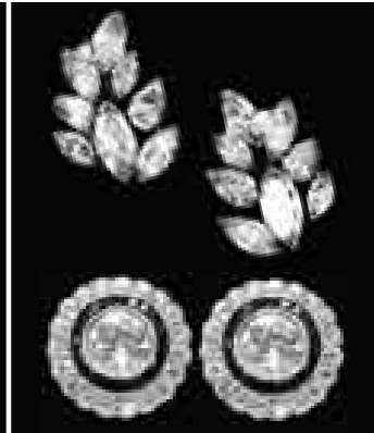
ARETES DE DIAMANTES