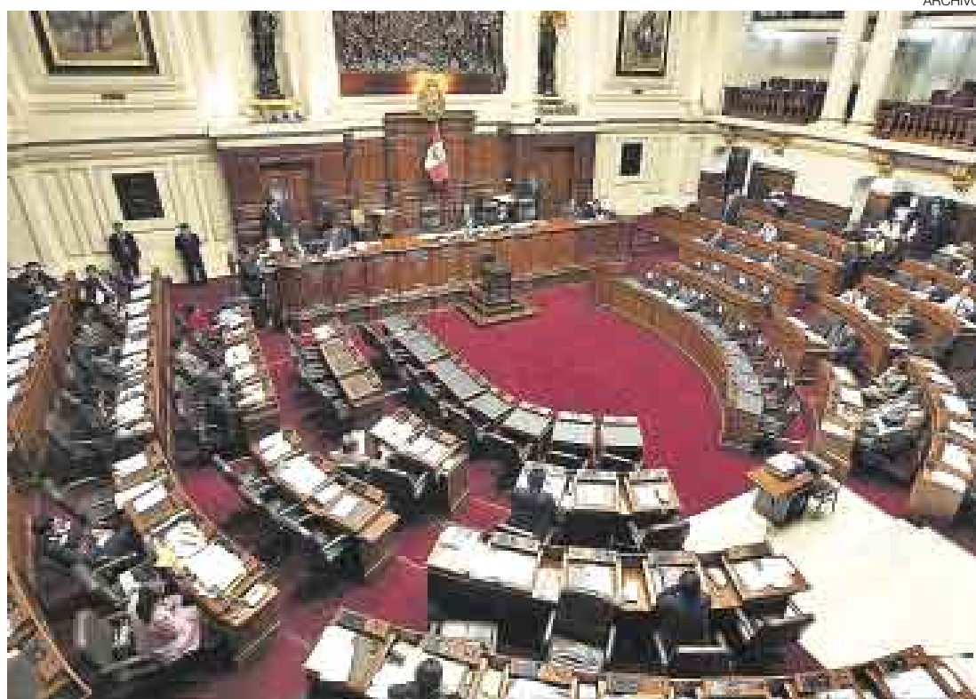
TIENEN LA PALABRA. El pleno del Congreso tendrá tres sesiones para ver temas de reforma constitucional.