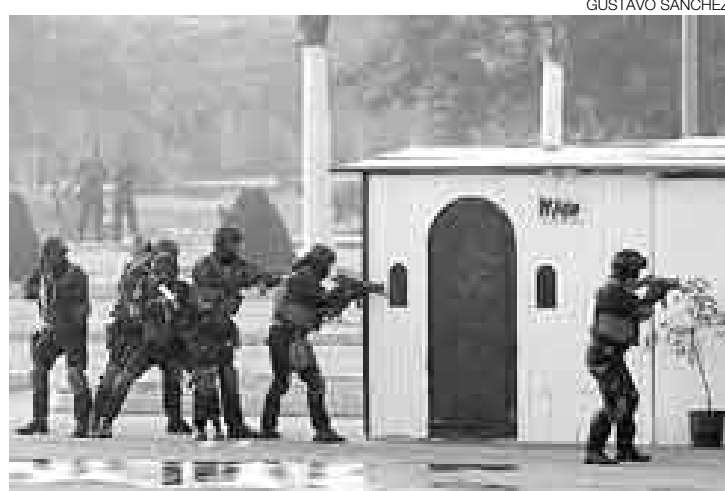
EL SUAT EN ACCIÓN. Efectivos de Rescate de Rehenes en los momentos previos a la incursión a una casa con supuestos rehenes.

LALLEGADA Y LA SALIDA Según la información proporcionada en el ensayo general, la llegada al aeropuerto Jorge Chávez y el desplazamiento de las comitivas hacia los centros de alojamiento y luego a las sesiones y viceversa constituyen los momentos de mayores riesgos para un ataque.