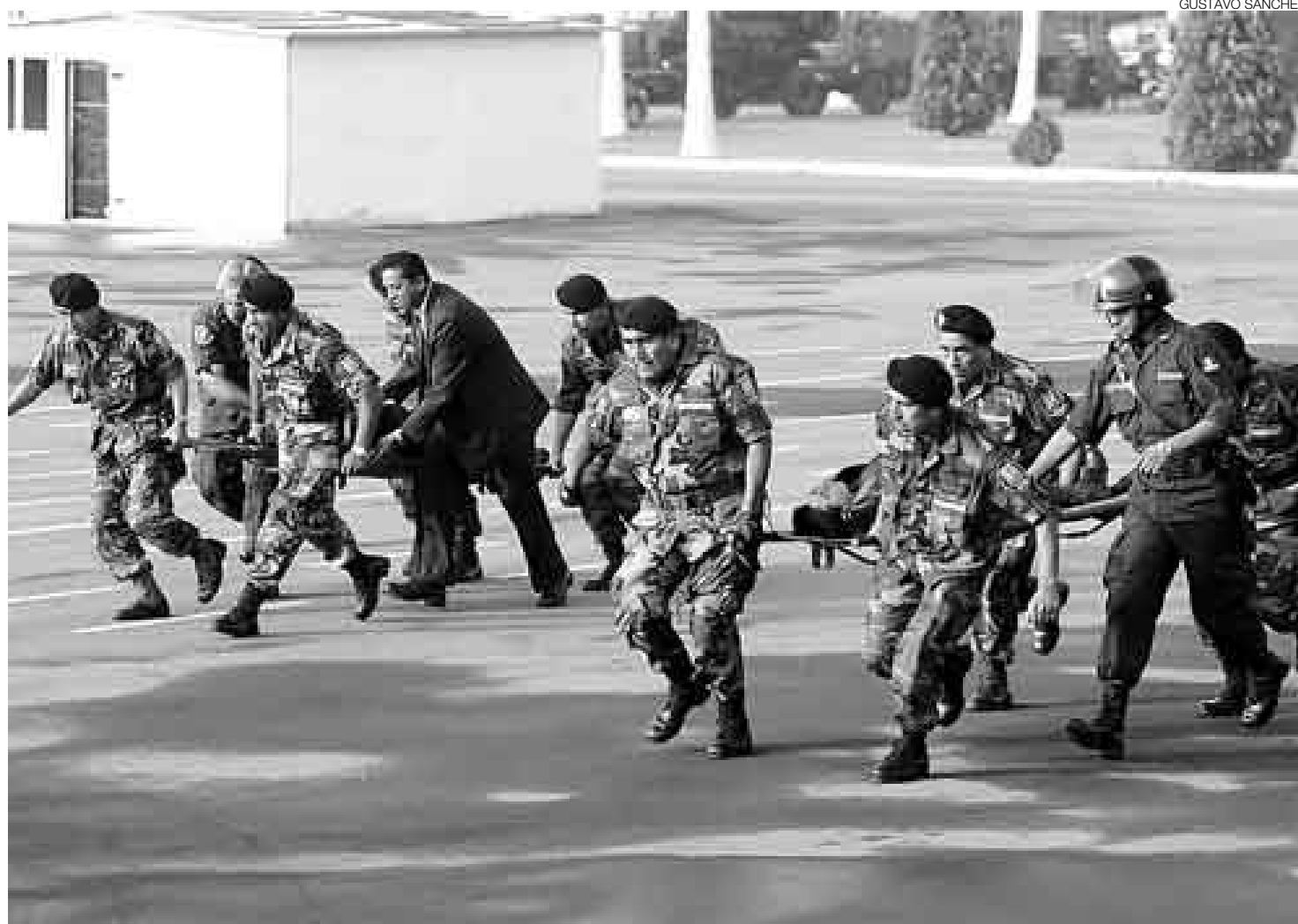
SIMULACRO. Dos 'heridos' son trasladados tras un fallido atentado. Todo era parte de un simulacro de ataque a una comitiva oficial.

Agregó que son 94 mil 500 efectivos con que cuenta la Policía Nacional en el país, los que se mantendrán firmes en el resguardo no solo de las actividades que se desarrollen por las cumbres internacionales sino también de la seguridad pública que requiere la población, la cual no se descuidará por estas reuniones.