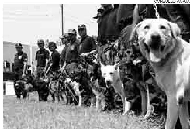
SU ARMA EL OLFATO. Estos perros fueron amaestrados para detectar explosivos y también para defensa o ataque según sea el caso.

Una demostración sobre la forma como será su actuación fue hecha ayer en la Escuela de Oficiales y en la sede de la Policía Canina en el cuartel El Potao, en el Rimac. Allí los animales demostraron su excelente preparación.