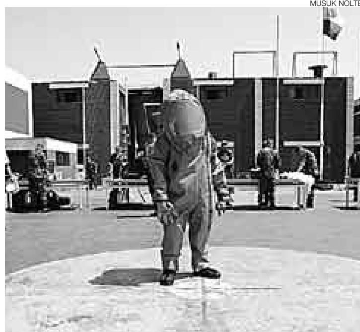
EMERGENCIAS. Los integrantes del equipo NBQ utilizan trajes especialmente diseñados para atender las emergencias.

Los miembros de NBQ se visten con trajes especiales y coloridos, además usan máscaras y