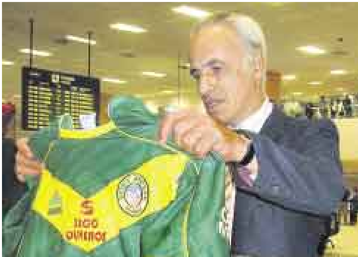
ESTOY CONTIGO. Técnico uruguayo ya entrena en el Rosas Pampa.