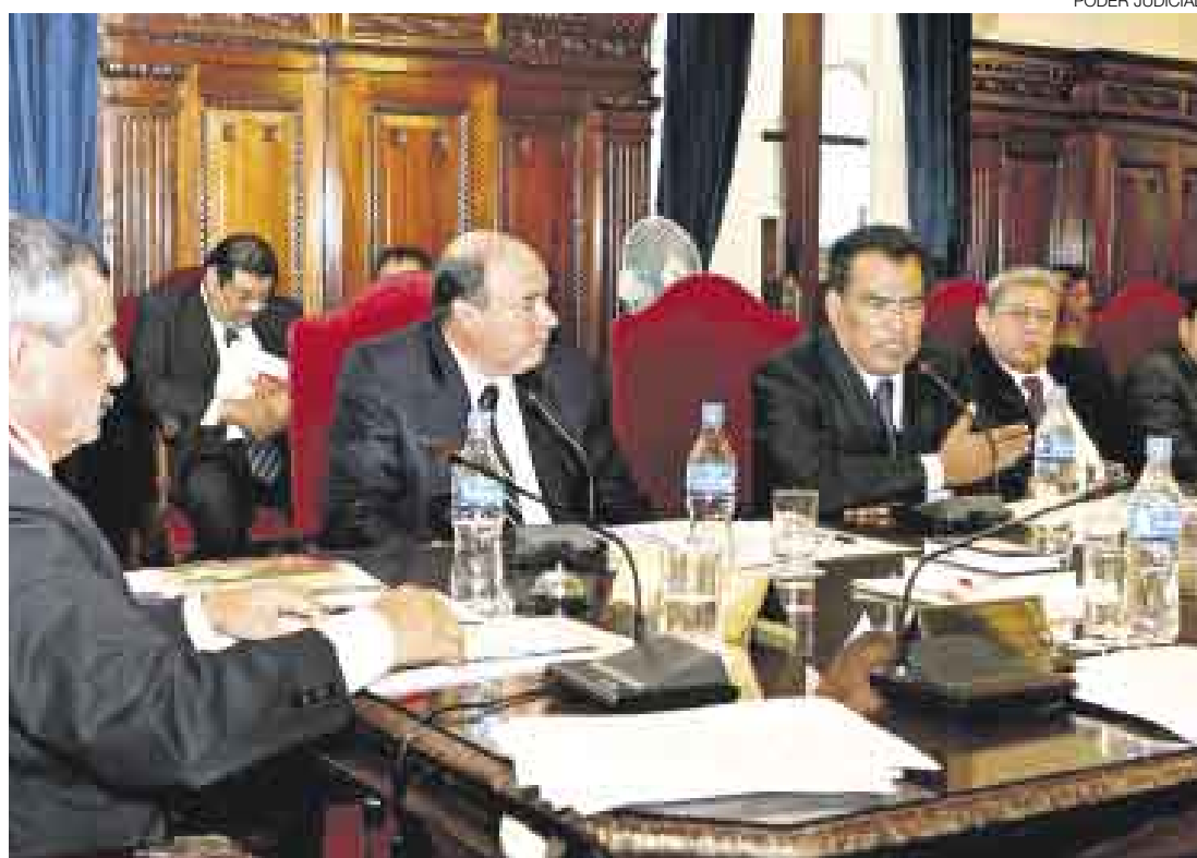
DEBATE CONJUNTO. Congresistas aceptaron mayor parte de observaciones que hicieron los magistrados.