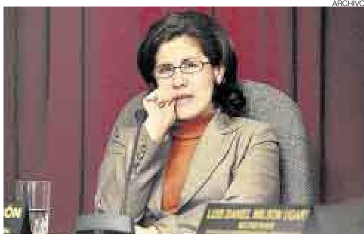
A LA ESPERA. Florián reclama que el Ejecutivo informe sobre funcionarios.

Sin embargo, recién el martes 6 de mayo se presentará el primer ministro Jorge del Castillo