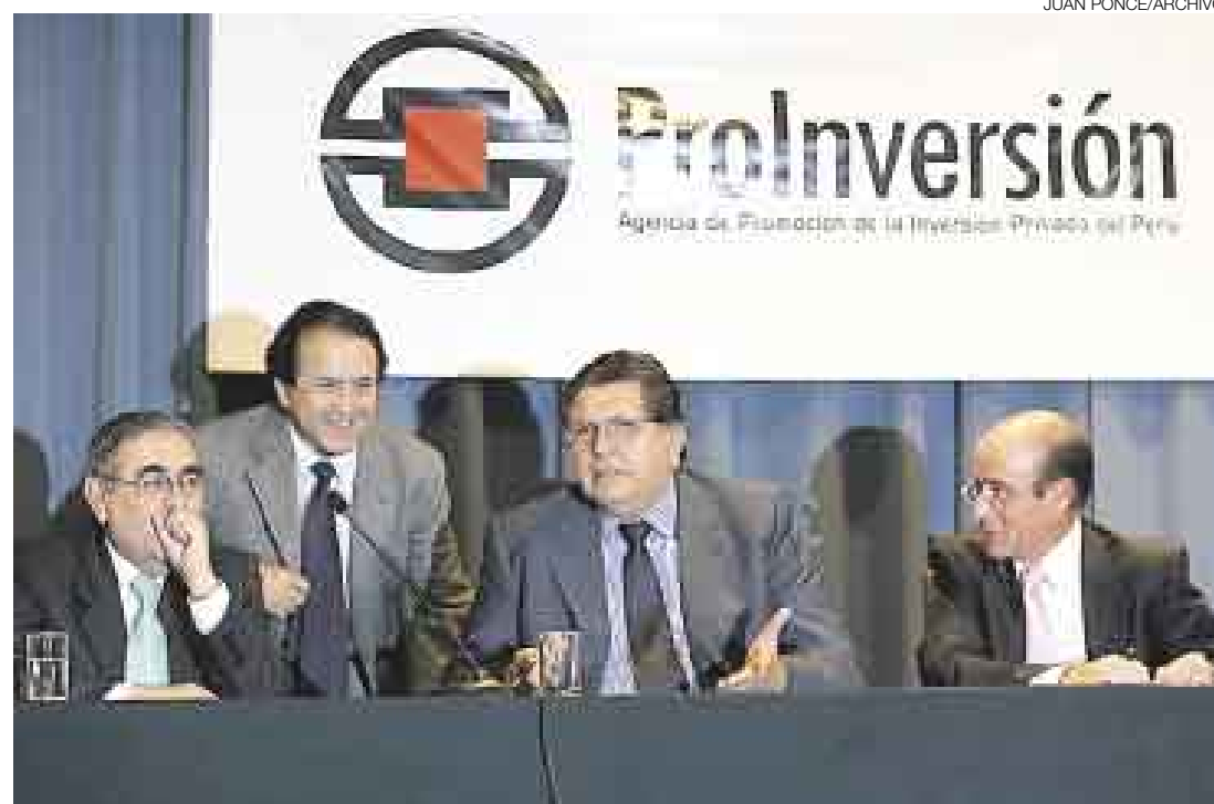
LO PASADO, PASADO. El aporte de David Lemor en Pro Inversión no habría satisfecho al presidente como si lo hizo en la ratificación del TLC con Estados Unidos. Por el momento, el director de la agencia está callado.

Además, se le otorga el derecho a cada ministerio de decidir