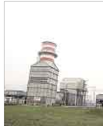
OFERTA. Deberán ofrecer no menos de 21 mil conexiones en ocho años.

Después de casi un año de esfuerzos por llevar adelante la descentralización en el abastecimiento del gas natural de Camisea, finalmente hoy se darán los primeros pasos firmes al otorgarse en concesión la distribución de este hidrocarburo en la región Ica.