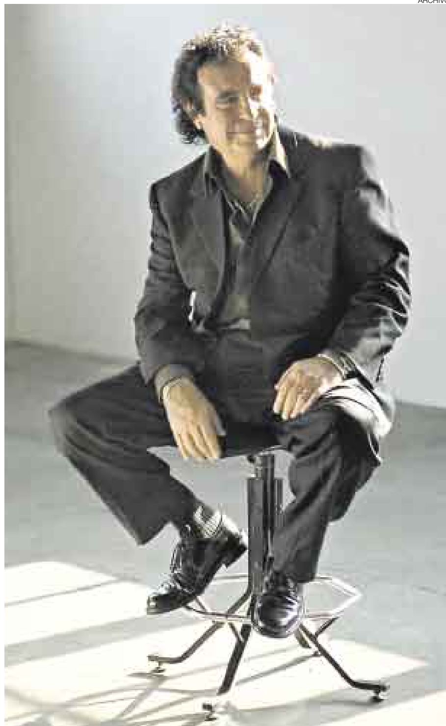
ESE HOMBRE. El español presentará en Lima una nueva fecha de su gira "Volvete a ver".