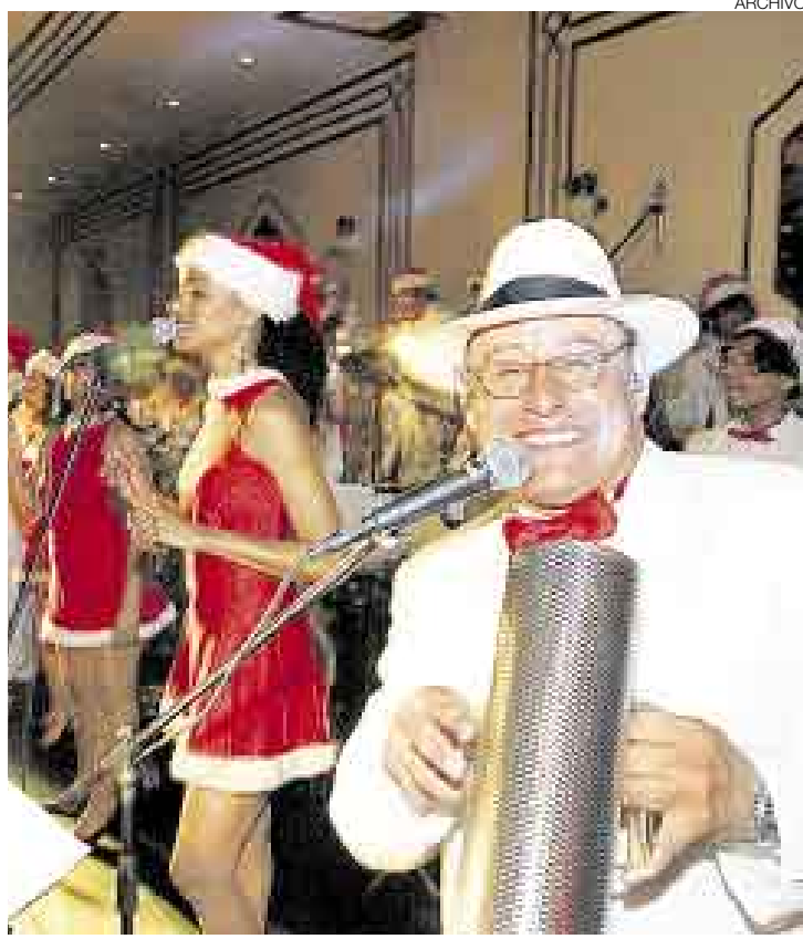
JOSELITO. Estará esta tarde cantando y bailando en el Sheraton.