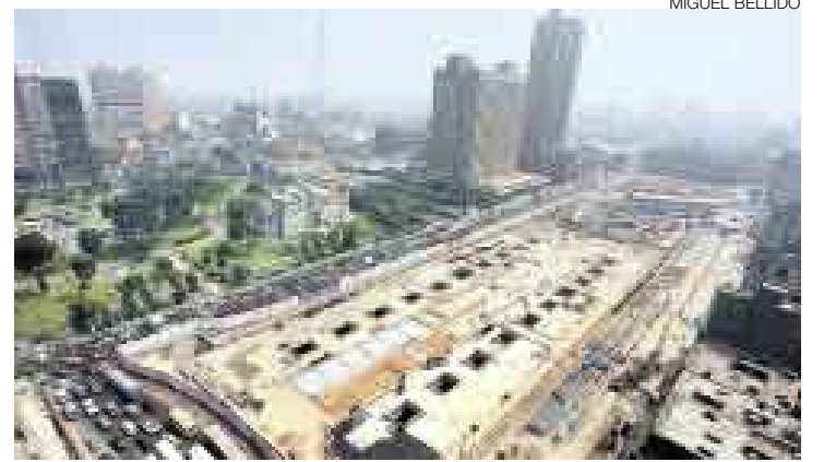
GRAN TERMINAL. Más de 200 mil metros cúbicos de tierra han sido removidos para construir los dos niveles de la estación central.

PERO NO SE UTILIZARÁ HASTA FINES DEL 2009