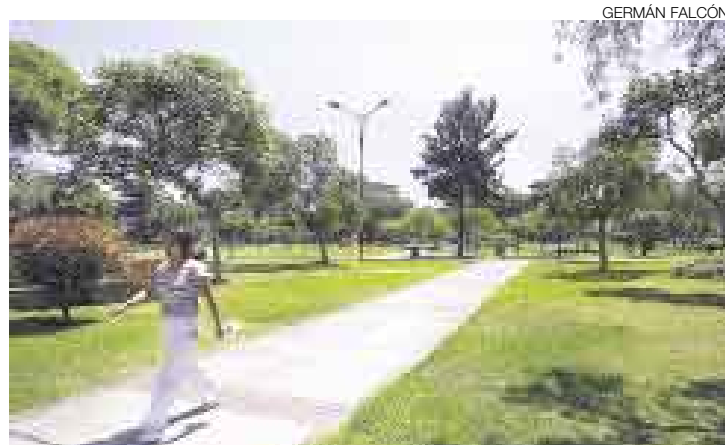
ORNATO. Cuidado de áreas verdes ocupa agenda de juntas vecinales.

1 Iniciativa en la formación de disposiciones municipales. Para ejercerla se requiere el respaldo mediante firmas, certificadas por el Reniec, de más del 1% del total de electores del distrito o provincia correspondiente.