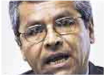
WASHINGTON ZEBALLOS CONGRESISTA

Se reconoce la necesidad de volver a dibujar el mapa político del Perú para aprovechar mejor sus ventajas, pero ¿cómo? En tal sentido se están tomando iniciativas desde diversos sectores y con distintas ópticas. El Comercio consultó a técnicos y autoridades involucrados en este proceso para saber qué se está haciendo para construir un Estado descentralizado, y cuánto se ha avanzado en este sentido.