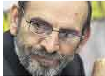
YEHUDE SIMON PRESIDENTE REGIONAL LAMBAYEQUE

“Existen dos instancias de ensayo regional. La primera son las juntas de coordinación interregional, pero también existe una región piloto. Falta –y esa es tarea del legislativo– tener claras las normas con las que tengamos que enfrentar esta realidad. El país está experimentando mecanismos inéditos, por eso nos parece sensato ir con pies de plomo y no apurar ni insistir en plazos que se pueden incumplir y dejar una sensación de fracaso”.