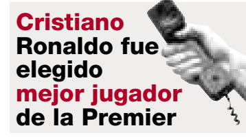
Cristiano Ronaldo fue elegido mejor jugador de la Premier

A su vez, el italiano Gianluca Zambrotta ha admitido que en el partido de hoy tendrán que actuar con inteligencia. "No hemos recorrido un buen camino fuera de casa en la liga, pero en la Champions ha sido diferente y hemos estado mejor", remarcó.