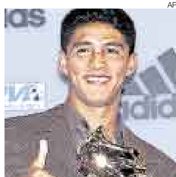
CARTEL. En los 90 fue uno de los mejores delanteros del mundo.

co mis errores. No uso cocaína desde hace dos meses, pero no puedo dar ninguna garantía de que no caeré en el vicio otra vez, porque estaría mintiéndome a mí mismo", aseguró.