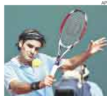
FELIZ. El número 1 del mundo ya sueña con el Roland Garros.

"Presioné a Rafa y sentí que podía vencerlo si jugaba de la manera adecuada. No tuve este sentimiento el año pasado. En tierra batida contra él, tienes que servir bien y