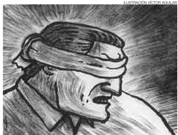
ILUSTRACIÓN VÍCTOR AGUILAR

Irónicamente, independientemente de que Lugo se acerque a Chávez o no, a EE.UU. y a América Latina les conviene que al nuevo presidente le vaya bien, y que Paraguay siga siendo un país “famoso por nada”. ■■