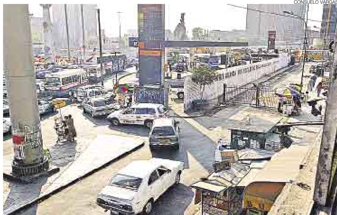
PANDEMONIO. Para el decano del Colegio de Ingenieros, se debería colocar semáforos provisionales.

■ Cerró reja instalada para dar seguridad a sus camiones-cisterna que se abastecen de noche