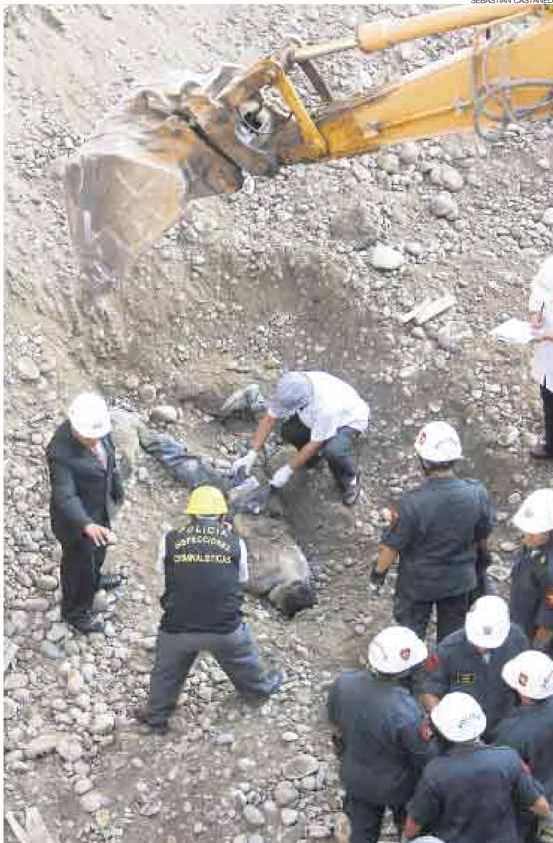
LUTO. A las 4:45 p.m., casi cinco horas después del accidente, se pudo rescatar al primer cadáver. Los socorristas continuaron trabajando durante la noche y, para los 10:00 p.m., habían hallado a otras dos víctimas.

A las 4:45 p.m., se desenterró a la primera de las víctimas y la esperanza de un milagro se debilitó aun más. Mientras llevaban el cadáver a un vehículo del Departamento de Homicidios de la Dirección de Investigación Crimi-