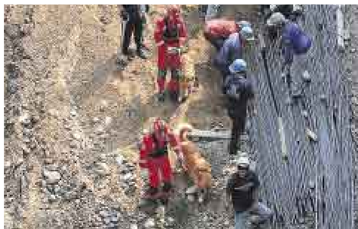
SABUESOS. Los bomberos localizaron los cuerpos de los obreros atrapados con la ayuda de dos perros Golden Retriever.

■ Doce obreros fallecieron este año en todo el país en obras de construcción, según el líder sindical Mario Huamán.