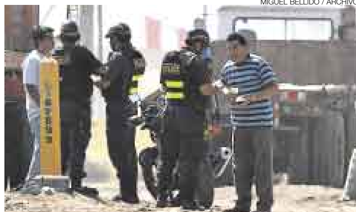
IN FRAGANTI. Los policías que protagonizaron esta escena fueron denunciados ante el Ministerio Público por el delito de corrupción de funcionarios.

Los tres fueron sorprendidos por un reportero gráfico de esta casa editora, cuando hacía un re-