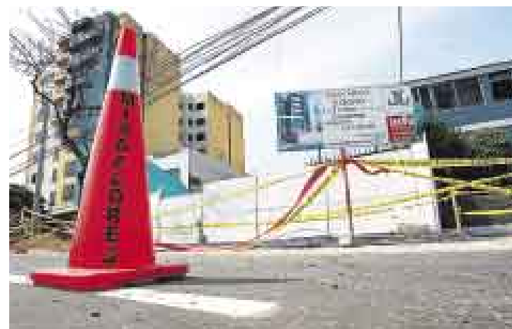
CLAUSURADO. Efectivos del Serenazgo de Miraflores resguardaron ayer el lote donde se produjo el derrumbe, que permanece cerrado.

fe departamental del Indeci, el ancho de la calzada que se derrumbó era homogéneo: alrededor de 40 centímetros.