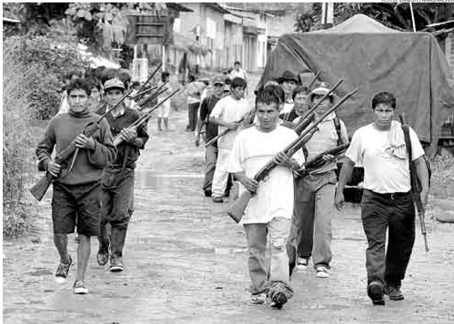
EN RIESGO. Los miembros de los comités de autodefensa en el VRAE también están expuestos a las emboscadas de los narcoterroristas.

Dos horas y media después volvieron a enfrentarse en la ruta hacia Chinquilpa, a dos kilómetros de los ductos del gas de Camisea. Esta columna estaría encabezada por el narcoterrorista conocido