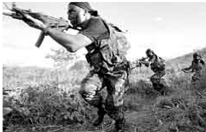
CON TODO. Las maniobras de práctica de los efectivos del Ejército en el VRAE han dado paso a operaciones de búsqueda de asesinos de ronderos.