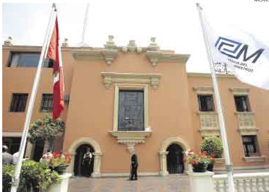
¿ESTA VEZ SÍ? En la PCM parecen empeñados en que el Ceplan se convierta en un organismo real.