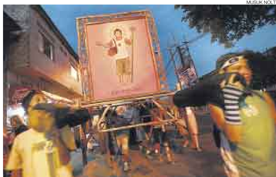
EN PROCESIÓN. El Niño Jesús de la Caja recorre las calles de Iquitos.

El jueves último los niños trabajadores de Iquitos sacaron en cortejo al que podría ser su nuevo patrono. La imagen de un pequeño lustrabotas fue paseada en andas para llevar el mensaje de que los menores sufren abusos y maltratos, pero están dispuestos a reclamar sus derechos. [A26]