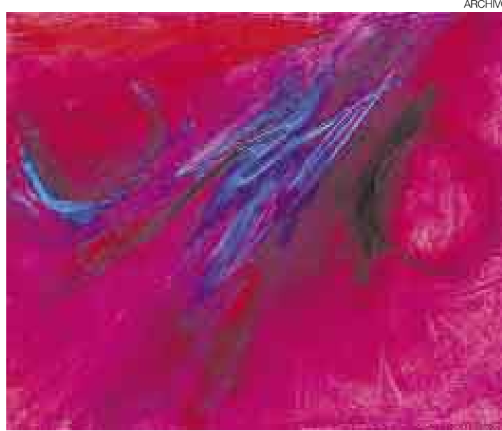
ABSTRACCIONES. Moll exhibe una obra decidida por una gestualidad al servicio de un color brillante, vibrante y nada tímido en los contrastes.

En cuanto a la pintura, la exposición que está presentando en estos días en La Galería de San Isidro, que ha titulado "Carnaval", muestra una versión actualizada y vigorosa de una etapa anterior de su obra. Son abstracciones decididas por una gestualidad al servicio de un color brillante, vibrante y nada tímido en los contrastes. Son lienzos que parecen recordar partituras orquestales, trazos violentos, abiertos y gruesos, muchas veces paralelos o interrumpidos por el círculo impreciso o la herida transversal, tratando de transmitir esa euforia desbordada de la fiesta pagana. Reinando rojos y negros, Moll también ensaya alguna pieza de fondo gris y formas despe-