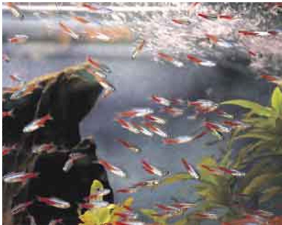
DE COLORES. Los peces neones no solo acompañan, también embellecen el acuario.