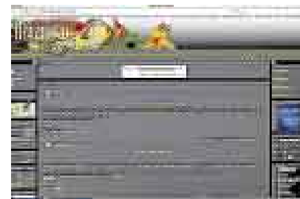
CONECTADOS. El foro de los acuaristas del Perú.

iniciativa es informar sobre los artículos que realmente se requieren para armar un acuario en casa y evitar ser víctima de estafas, así como los precios a pagar por los animales, los que