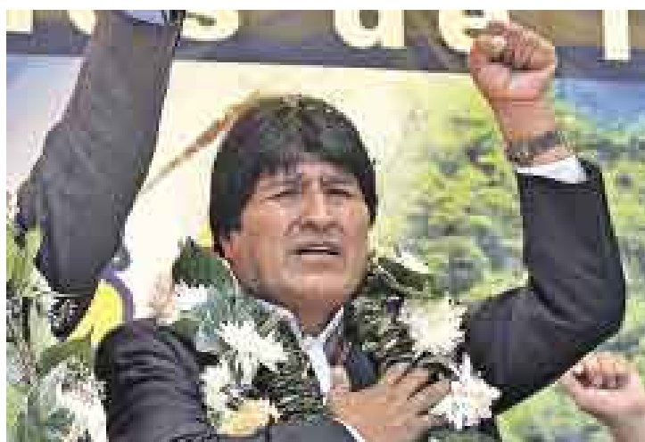
EN SU HORA DIFÍCIL. Habrá que esperar qué tipo de medidas tomará el presidente boliviano, Evo Morales, luego del referéndum cruceño.