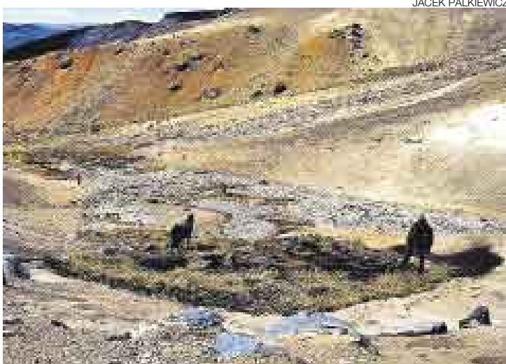
A 5.170 METROS. Este pequeño bofedal, ubicado encima de capas de hielo subterráneo, es el punto exacto donde nace el Amazonas.