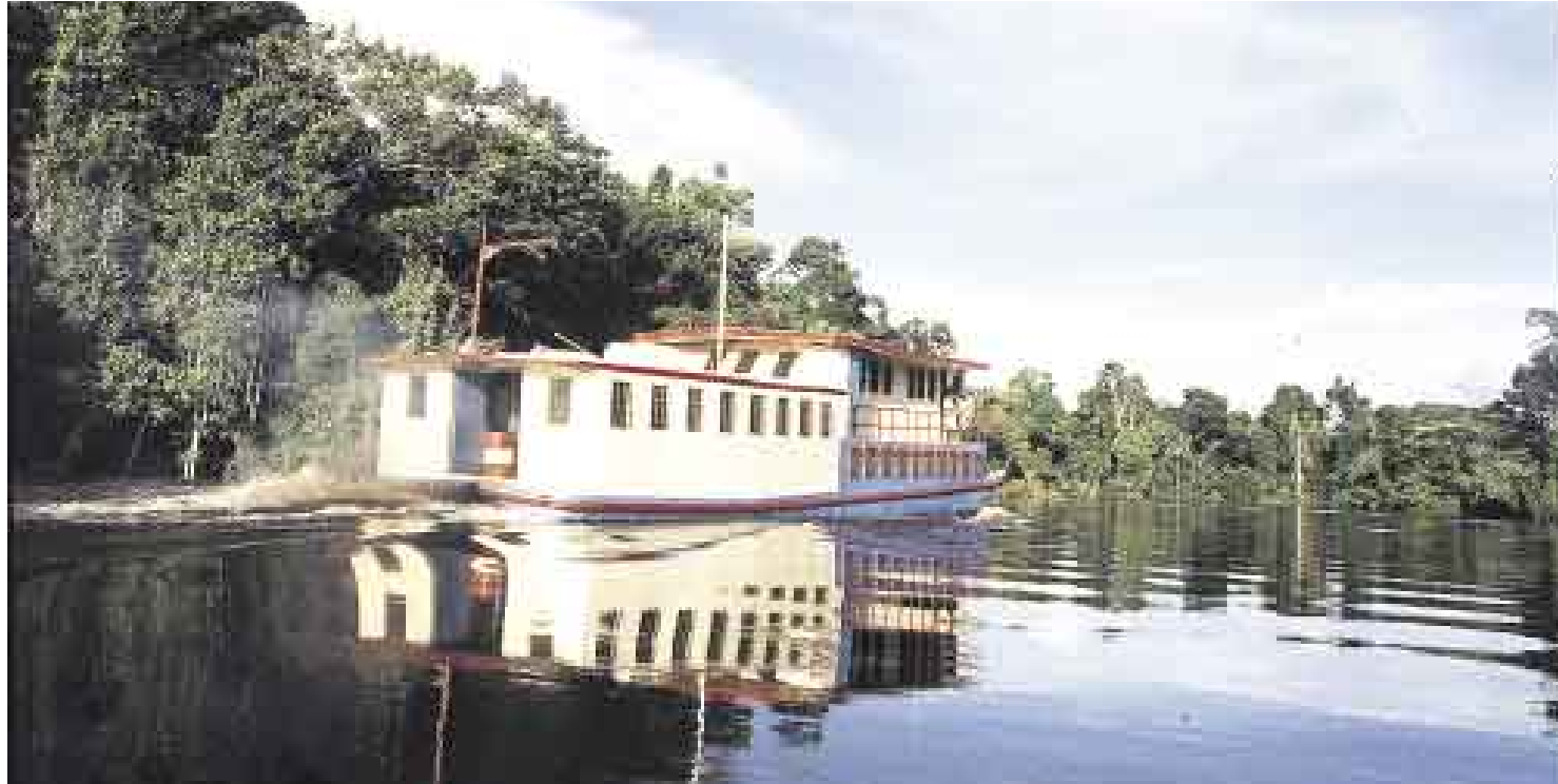
EL MÁS LARGO DEL MUNDO. El Amazonas, con sus 7.000 kilómetros de longitud, es el río más largo del mundo, por encima del Nilo, incluso.

Es difícil creer que una insignificante porción de tierra fría y fofa ubicada a 5.170 metros sobre