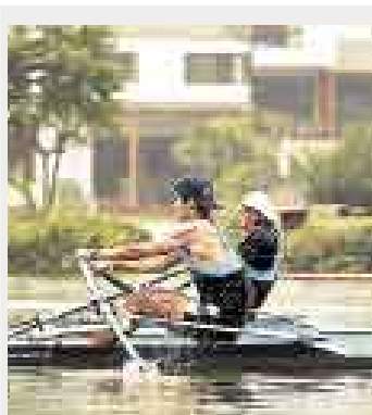
Bogas irán a lagunas de La Molina.

mo oficializó el calendario de actividades del presente año, el mismo que comenzará el 1 de junio próximo con el XIII Torneo Las Lagunas de La Molina, una prueba reservada para singlistas. El 22 de junio se disputará el Nacional Infantil en La Punta. Los campeonatos para Cadetes, Seniors y Másters se disputarán en la última parte