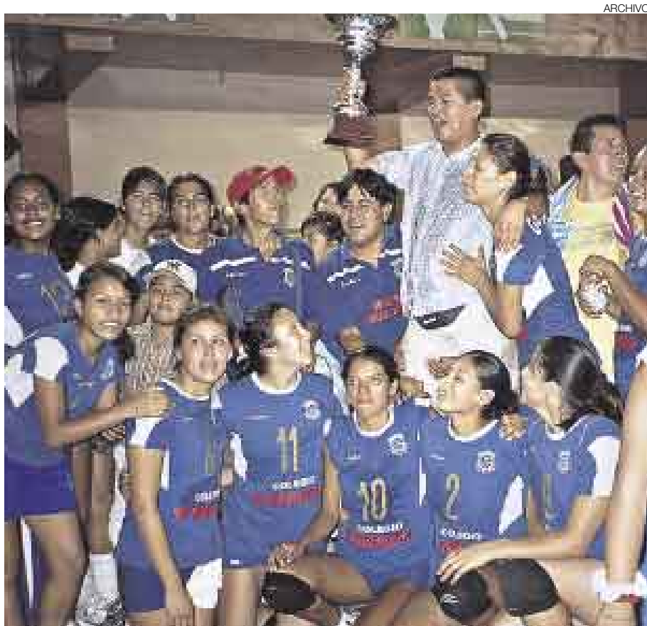
GÉMINIS. El campeón vigente, el Géminis de Comas, será el gran protagonista del torneo.