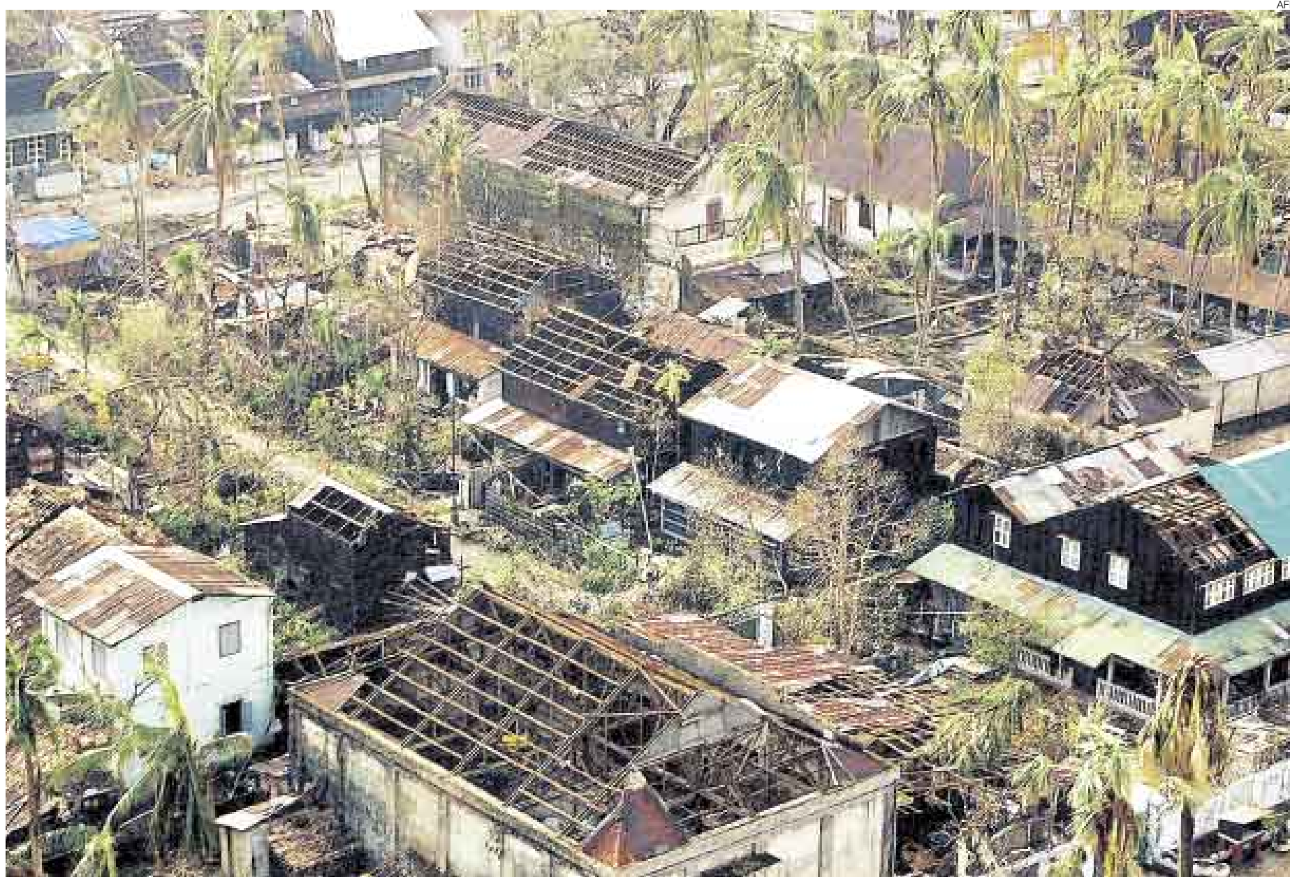
DESASTRE. Las zonas más afectadas por el ciclón Nargis han sido las que se encontraban en las vastas tierras pantanosas cercanas al delta del Irrawaddy como la ciudad de Bogalay.