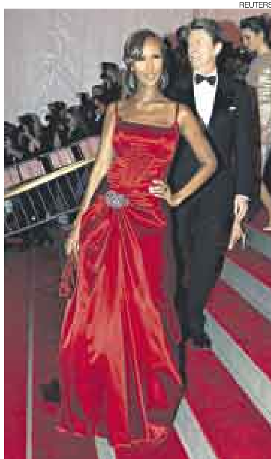
MATADORES. La modelo Iman y su esposo David Bowie llegan a la gala.