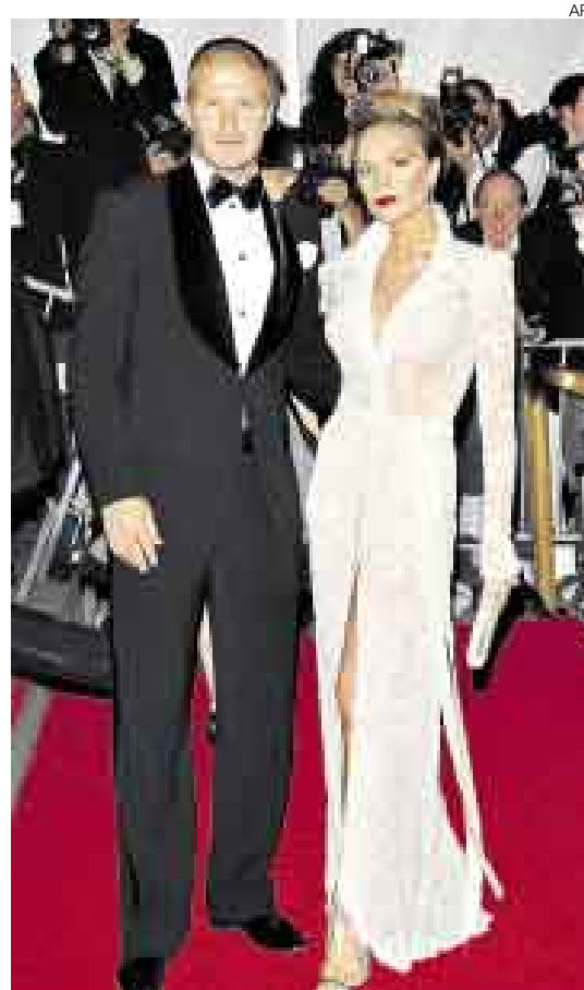
CÉLEBRES. David y Victoria Beckham brillaron al llegar al Metropolitano.