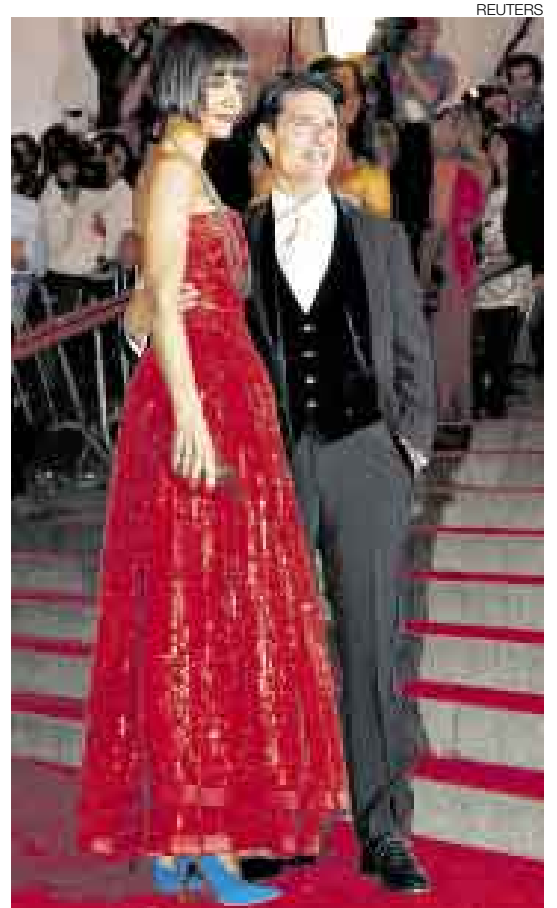
LLAMATIVOS. Tom Cruise y su esposa Katie Holmes, ella una vez más en rojo Valentino.