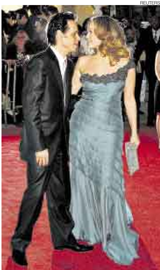
INFALTABLES. Marc Anthony y Jennifer López, entre los mejor vestidos, como siempre.