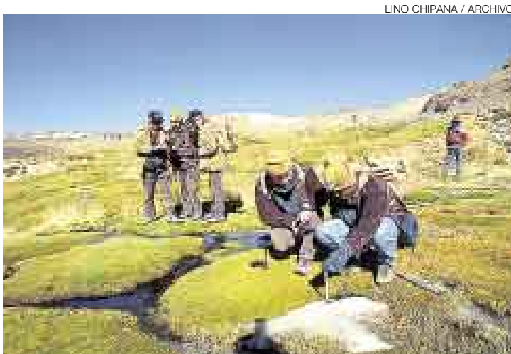
PRECISIÓN. Los miembros de la Sociedad Geográfica de Lima corroboraron durante 12 años los estudios hechos en 1996.

Este tiene como fin la creación de un espacio que sirva para preservar el punto donde se ubica el inicio del afluente más largo y caudaloso del mundo, localizado en las alturas de la quebrada Apacheta, nevado de Quehuisha,