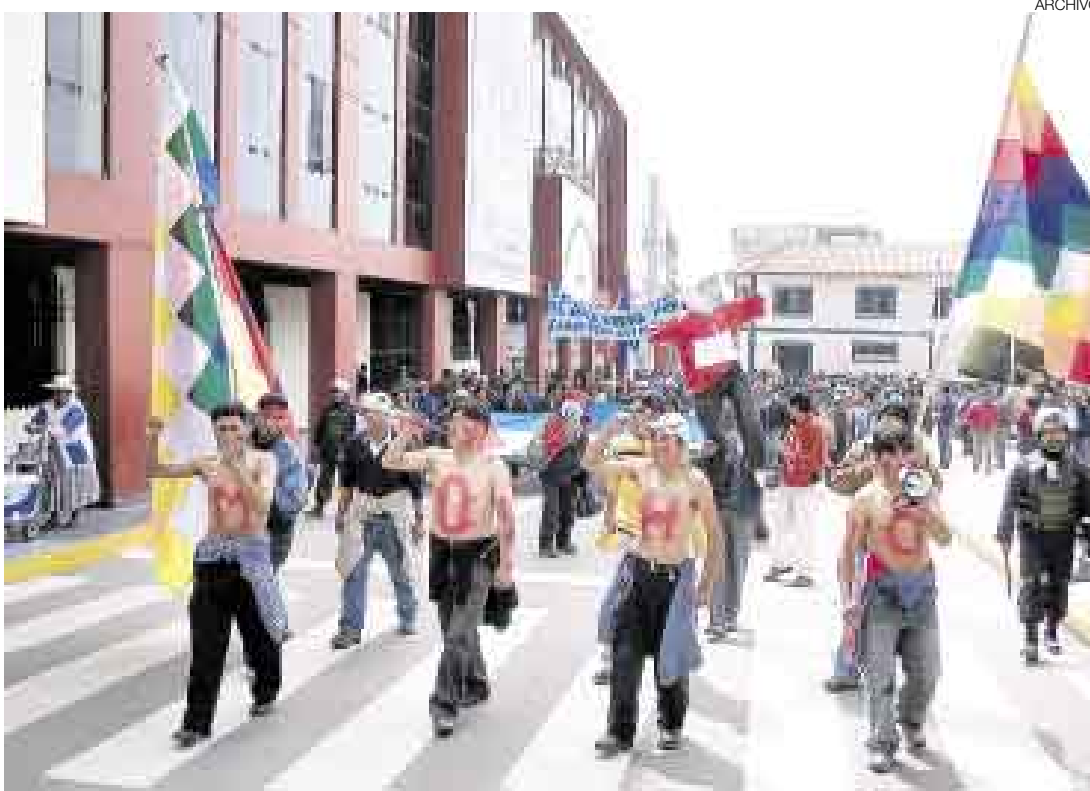
¿CORTINA DE HUMO? Para los opositores de Fuentes, la facultad recibida es para impedir protestas en su contra.