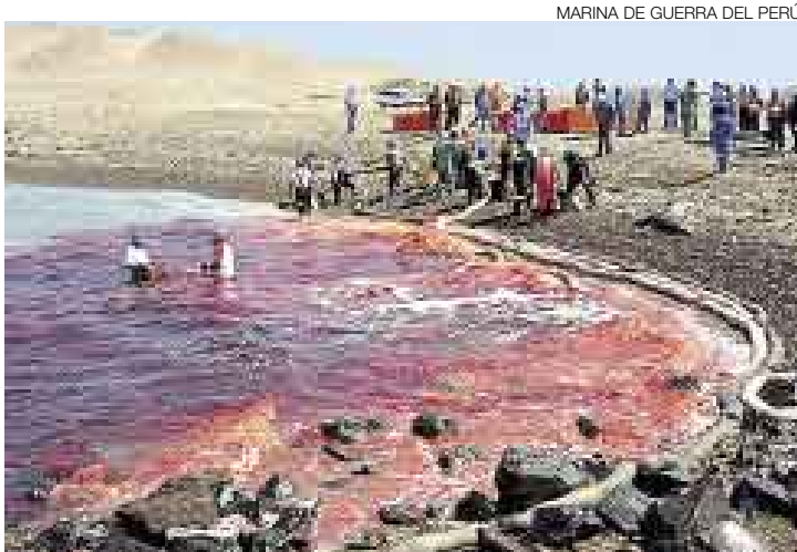
¿ERROR DE CÁLCULO? Un error del piloto del barco estadounidense al momento de acoderar habría producido el accidente.

9 a.m. y obligó a la Capitánía del Puerto de Pisco a ejecutar un plan de contingencia junto con el Inrena, Imarpe, Enapu y las empresas Pluspetrol y Cosmos. Esto consistió en el tendido de hasta tres barreras de contención que evitaron que los 1.500 galones de diésel derramados fueran arrastrados por las distintas corrientes marinas hacia la Reserva Nacional de Paracas, distante a unas 20 millas (38 kilómetros aproximadamente).