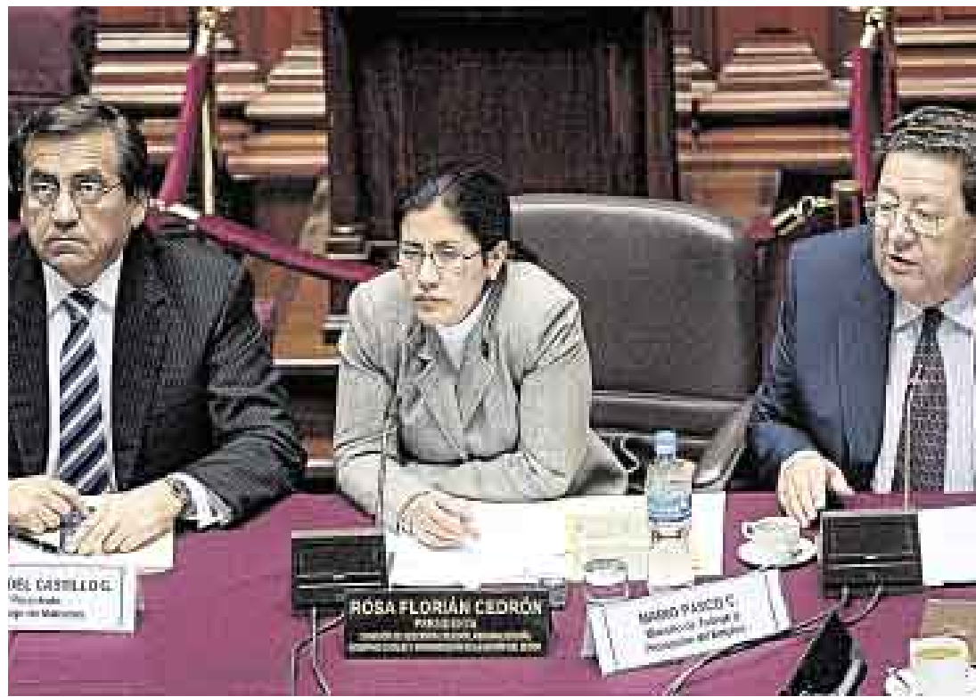
EL COSTO. El ministro Pasco reveló que implementar la ley del servicio público supondrá S/2.500 millones al año.

La propuesta concreta del Ejecutivo fue la formación de una comisión técnica conjunta con el Legislativo, a fin de elaborar la Ley del Servicio Civil, como la denominó Pasco. Esto en base a tres proyectos presentados por el Ejecutivo: el que modifica la Ley de Bases de la Carrera Administrativa, la Ley Marco del Empleo Público y la de incentivos por productividad. Esta última para reco-